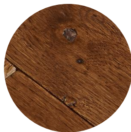
Nœuds non bouchés