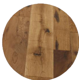
Gros nœuds et aspérités