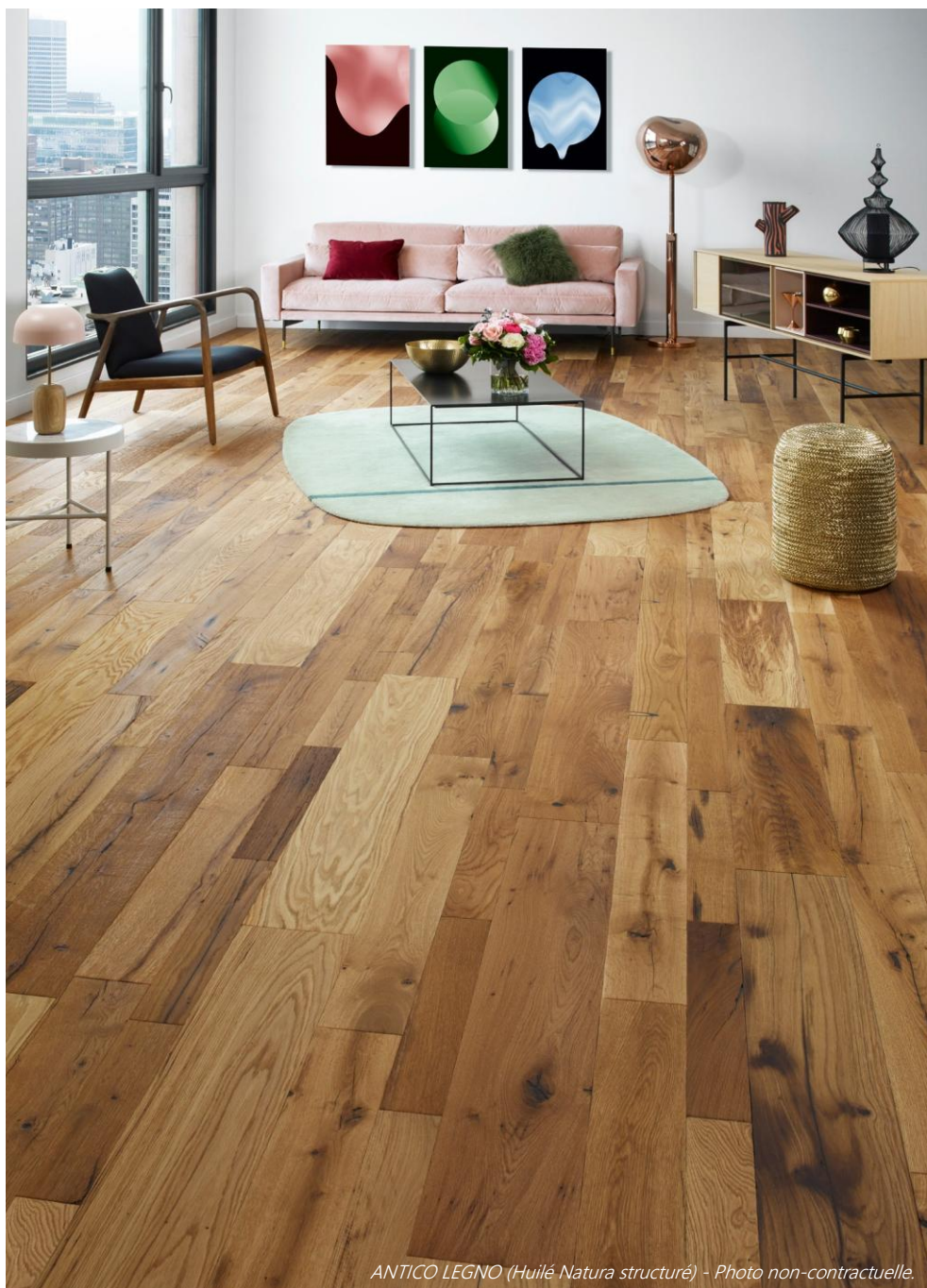
ANTICO LEGNO (Huile Nature structurée) - Photo non-contractuelle.