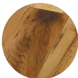
Aspect flammé et gerces