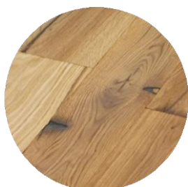
Pièces de bois pour reboucher les trous de chevilles