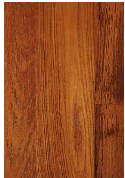
LOFT PRO 15 x 136 MM PAREMENT/TOP LAYER : 3.5 MM