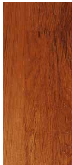
MASSIF / SOLID 9 x 84/88 MM