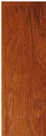
MASSIF / SOLID 9 x 64/68 MM